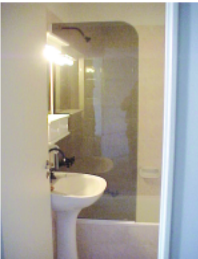
Mampara fija de una hoja. De cristal bronce con bordes redondeados (ECO-ALUM)