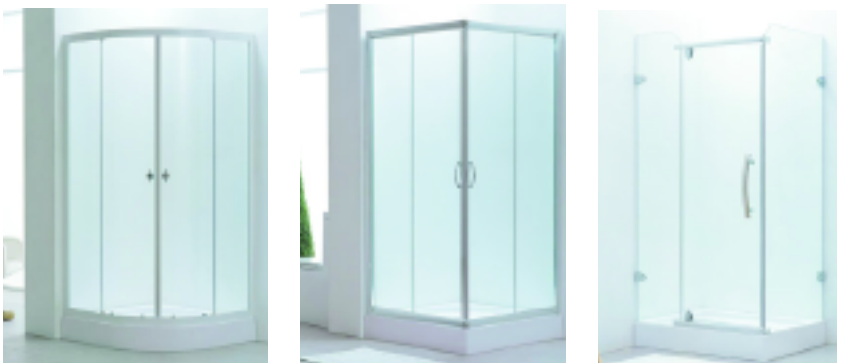
Cabinas de ducha compuestas por 2 mamparas de cristal templado translúcido. De paneles fijos más paneles de abrir (ARREDOBAGNO)

Paños de abrir o rebatible: se abren como una puerta hasta 180° aproximadamente. El marco lateral está formado con tres perfiles que hacen de bisagra y en la parte inferior el cristal lleva un burlete de PVC transparente que hace de freno y no deja pasar el agua (también se pueden usar burletes magnéticos).