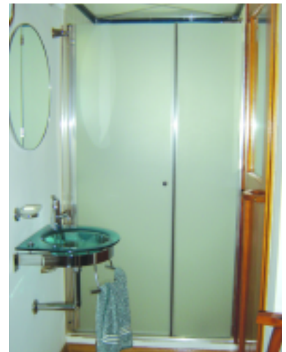
Mampara con una hoja fija y otra de abrir. Perfiles de aluminio anodizado y paneles en cristal opaco (SOLARIUM CERRAMIENTOS)

Paños corredizos: se adaptan a todas las medidas, por grandes que sean. Los módulos se deslizan sobre rieles y no necesitan ángulo de apertura. En las mamparas de 4 paños, los dos que se encuentran del lado de la pared son fijos, y los restantes, que quedan en el centro, son corredizos.