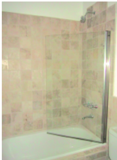
Mampara rebatible de una hoja. De cristal transparente con perfilera de aluminio (ECO-ALUM)