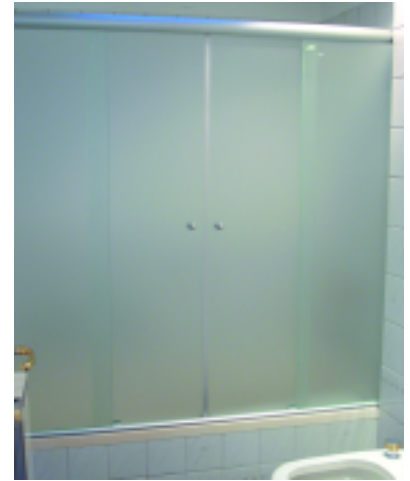
Mampara de dos hojas fijas y dos corredizas. Marco perimetral en aluminio, sin parantes verticales. De cristal templado esmerilado (ECO-ALUM)