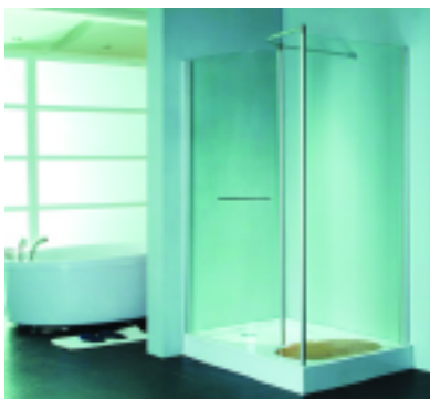
Preducha con deck de madera más ducha. Dos mamparas de paños fijos de cristal templado transparente de 8 mm (ARREDOBAGNO)

Agradecemos a las siguientes empresas por suministrarnos material para la confección de esta nota: