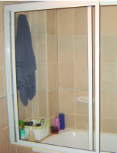
Mampara corrediza de dos hojas. Perfiles de aluminio pintado y paneles de cristal templado (SOLARIUM CERRAMIENTOS)