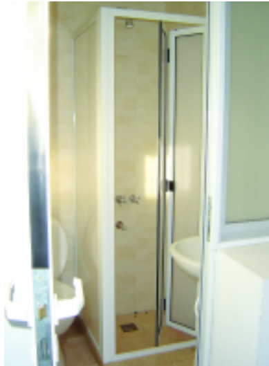
Mampara para box con puerta plegadiza. Marco perimetral en aluminio pintado (SOLARIUM CERRAMIENTOS)